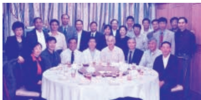
白綠一家五代同堂歡聚