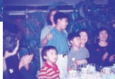
方大哥孫兒祝賀祖母生日 (歡迎宴會當天正值方夫人生日)