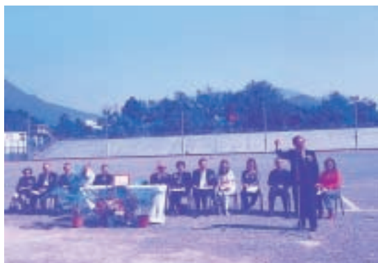
方創傑校友領導師生為健兒打氣