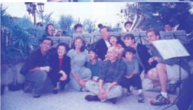
(歡樂在蔡主席別墅中)